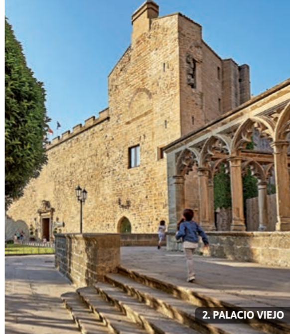
2. PALACIO VIEJO