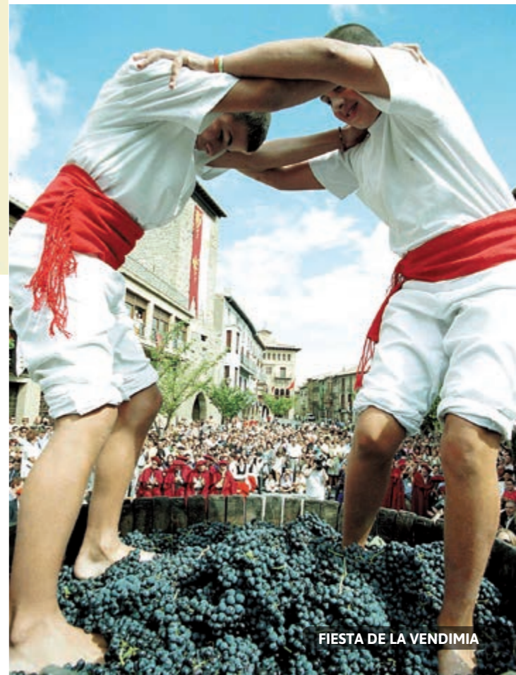
FIESTA DE LA VENDIMIA