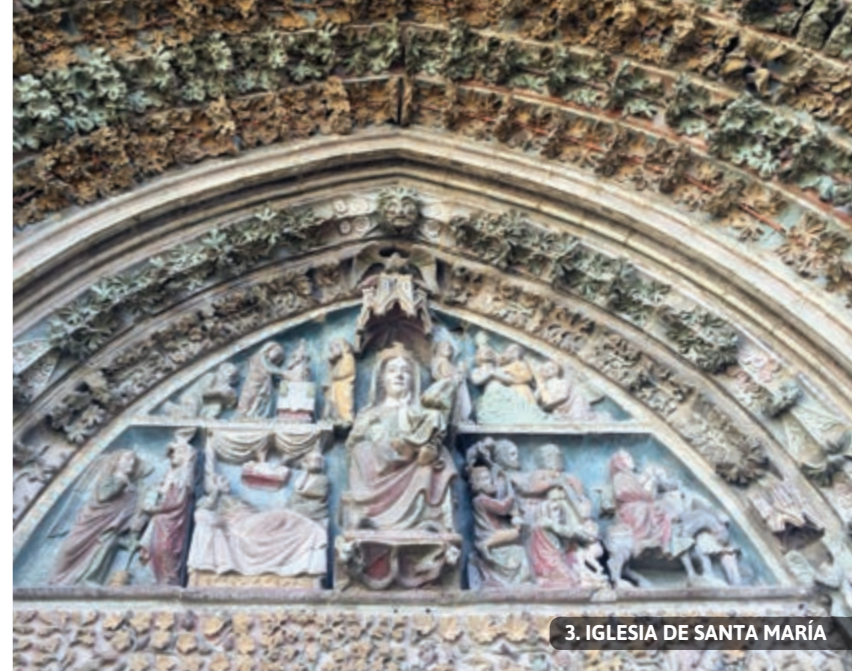
3. IGLESIA DE SANTA MARÍA