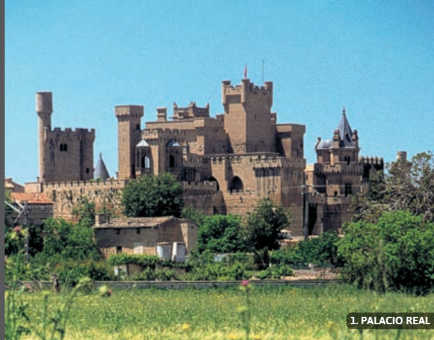
1. PALACIO REAL

A lo largo del año, existen otros encuentros festivos que invitan al visitante a acercarse a Olite. El sábado más próximo al 22 de mayo se celebra la romería a la ermita de Santa Brígida, en el monte Encinar. El domingo siguiente al 25 de abril, vecinos de Olite y de otros pueblos de la Zona Media participan en la romería de Ujué. El “Festival de Teatro Clásico de Olite” tiene lugar entre los meses de julio y agosto, en el que participan compañías de gran renombre. El día 26 de agosto se celebra la Virgen del Cólera, gran fiesta local. La fiesta de la Vendimia se realiza un domingo de la primera quincena de septiembre, con este evento la Cofradía del Vino de Navarra da comienzo a la campaña anual de recogida de la uva. Las fiestas patronales tienen lugar del 13 al 19 de septiembre.